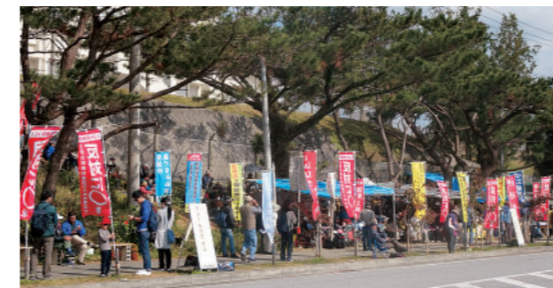
道ゆく人びとに「埋立反対に〇」をアピール

政府の言う「普天間基地の危険性除去のため」は、100%おためごかしです。辺野古の新基地は1800mの滑走路2本と、強襲揚陸艦や輸送船が接岸できる護岸、ヘリパッドなどが整備され、辺野古既設の弾薬庫や訓練場とあわせると最新鋭の攻撃基地になります。老朽化した普天間基地の「代替施設」どころではありません。当初計画で2400億円だっ