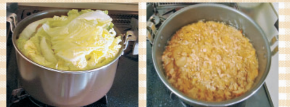
ぎゅうぎゅうに詰め込んで、トロトロに仕上げる